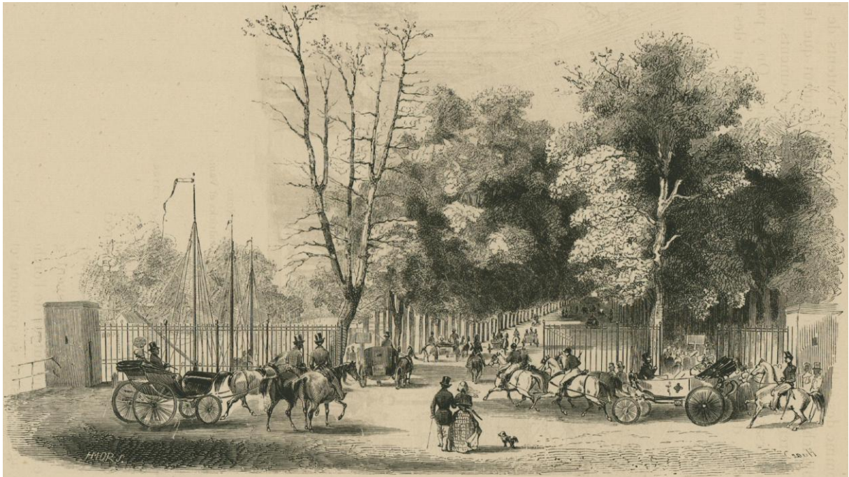
L'ALLÉE VERTE EN 1845. Dessin de Louis Huart, gravure de H. Mors, communiqué par M. Th. Falk, éditeur.